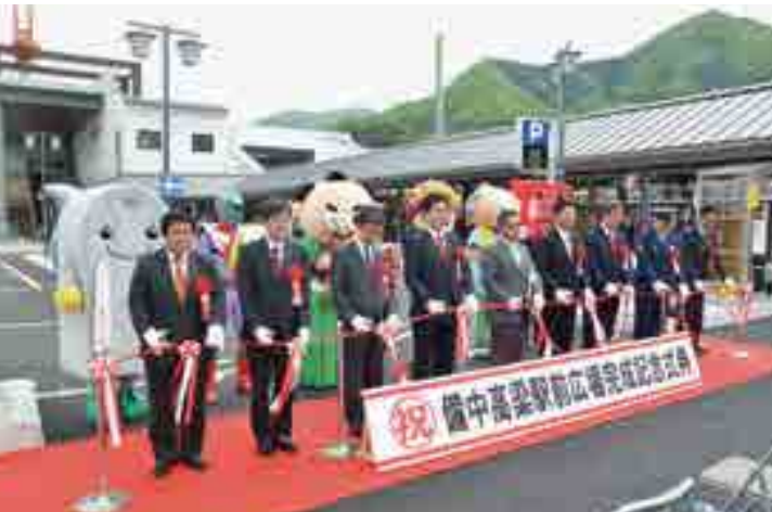
完成記念のテープカット

駅周辺の交通混雑の解消や歩行者等の安全確保のため進めていた備中高梁駅周辺整備事業が完了し記念式典が行われました。