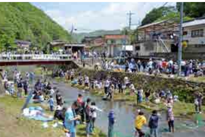
川を仕切って作られた専用釣り場

今回が最終回となった「第20回マス釣り大会」(清流を守る会主催)が開かれ、多くの参加者でにぎわいました。