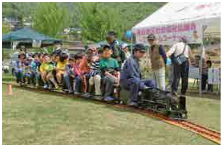
公園内を走るミニSL

晴れ渡った青空の下、「落合ふれあい公園まつり」(高梁商工会議所落合支部主催)が行われ、多くの家族連れが訪れました。