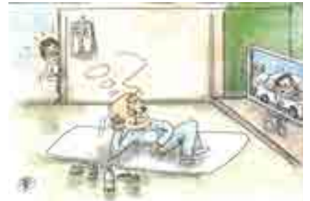
「渋滞の ニュース横目に ごろ寝酒」