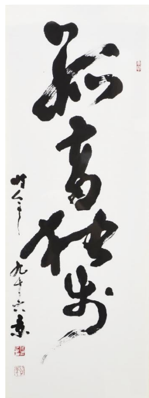
《孤高独歩》平成11年 96歳