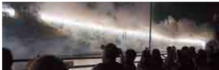
夏の夜を彩った踊り、屋台、花火

江戸時代から300年以上続く「備中名物成羽愛宕大花火」(同実行委員会主催)が開催され、成羽のまちに多くの観客が訪れました。