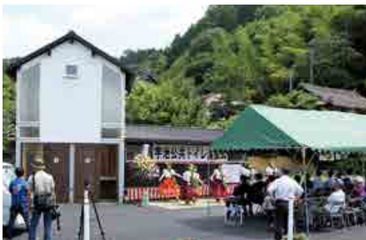
周りの景観に配慮した宇治公共トイレ

清潔で使いやすい設備で高梁の魅力アップに繋げる「トイレからのまちづくり事業」の第2弾として整備された宇治公共トイレの落成式が行われました。木造平屋で、トイレは全てバリアフリー設計となっており、南側には観光客の休憩や住民の交流スペースとしての利用を想定し、長さ6mのベンチがあります。総事業費は2343万円です。