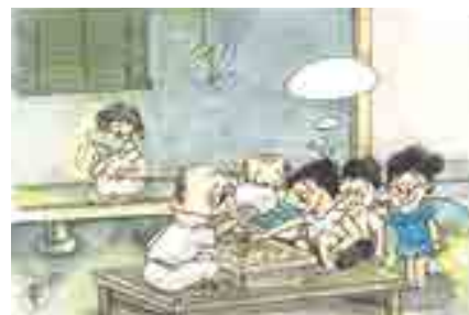
「涼み台 出せば天狗のへぼ将棋」