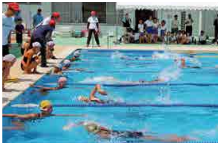
リレーで懸命に泳ぐ子どもたち

「第41回高梁市学童水泳記録会」(市教育委員会など主催)が開催され、市標準記録を突破した15校225人の小学生が出場しました。