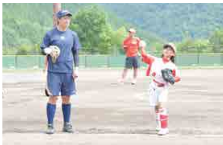
キャッチボールの指導中

日本女子ソフトボールリーグ1部で活躍しているシオノギ製薬ポポンギャルズ(兵庫県)によるソフトボール教室が開催されました。