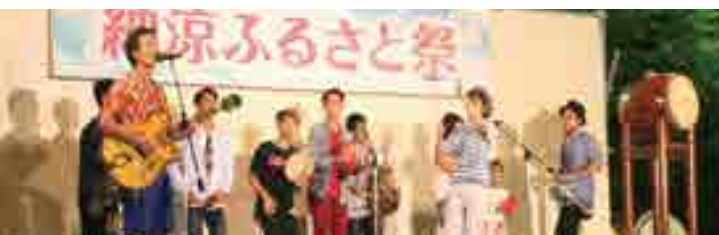
有漢ちゃんぶるオーケストラによる生演奏など

「有漢町納涼ふるさと祭」(同実行委員会主催)が開催され、大勢の家族連れでにぎわいました。