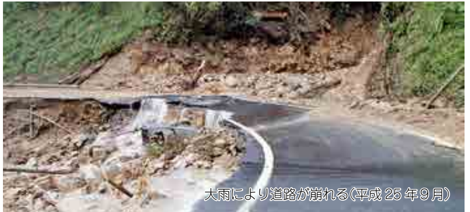
大雨により道路が崩れる(平成 25 年9月)

避難勧告が発令される可能性があります。避難ができるように準備します。避難にかかる人は早めに行動しましょう。