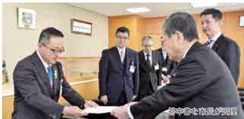
答申書を市長が受理