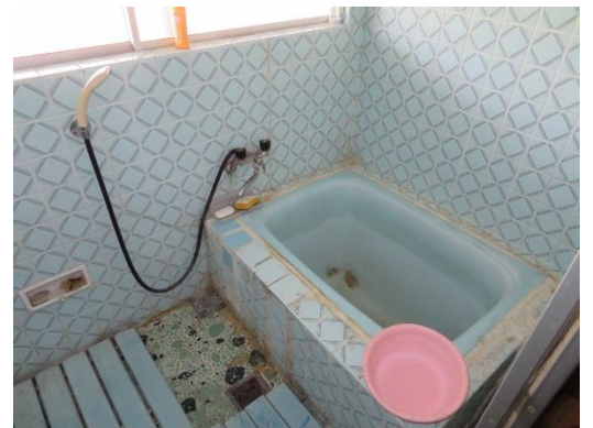
↓納屋(川を挟んだ向かい側)