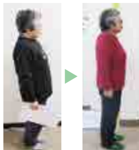
お腹が突き出て背中や腰を痛めやすい姿勢 背筋が伸びたきれいな姿勢に