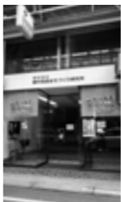
栄町商店街に整備されたアニメスタジオ

執行部からは、まち・ひと・しごと総合戦略に位置付けられた事業として「高梁発世界にアニメを発信事業」「葉草栽培産地推進事業」「官民協働による移住サポートセンター整備事業」に取り組んでいるとの報告がありました。 議員からは、実施期間が過ぎたら終わりというのではなく、いろんな方の協力もいただきながら取り組んでほしいとの提案がありました。