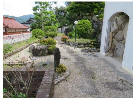
↑庭 ↓家から見える風景