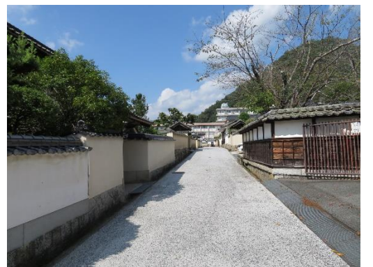
石火矢町武家屋敷通り (左手前が当該物件)