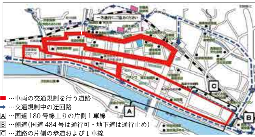
●…車両の交通規制を行う道路 →…交通規制中の迂回路 A…国道180号線上りの片側1車線 B…側道(国道484号は通行可・地下道は通行止め) C…道路の片側の歩道および1車線

※図のC区間は片側交互通行となります。中の進行はご注意ください。 ※2月8日(金)午後5時30分から2月10日(日)まで、市役所北駐車場は利用できません。 ※コース図は市ホームページで確認できます。