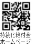
持続化給付金ホームページ