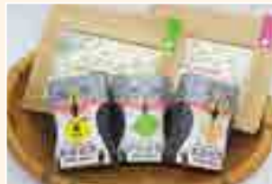
紅茶セット (百姓のわざ伝承グループ)