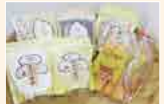
もち麦セット (宇治雑穀研究会)