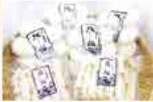
餅セット (農事組合法人ならい)