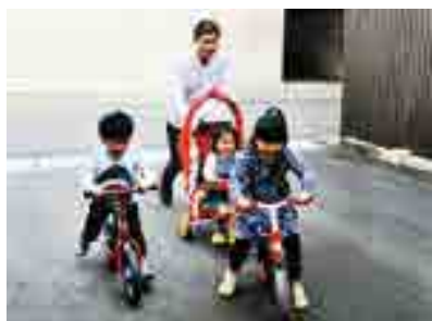
昨年の最優秀賞作品