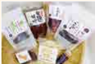
手づくりセット (方谷の里農産加工部)