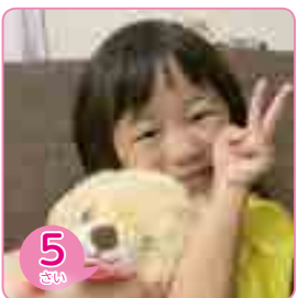
5 さい なかま ほのか 仲間 萌果ちゃん (落合町阿部)