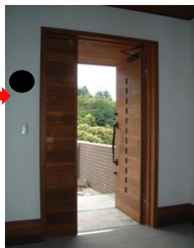
★シール 玄関内側の壁へ貼る