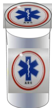
救急医療情報 キット容器