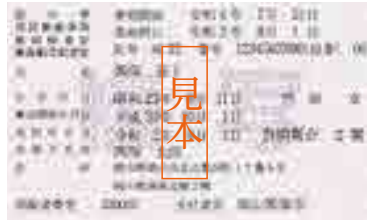
被保険者証兼高齢受給者証

※7月31日(土)までの期間に医療機関などで受診する際は、被保険者証と高齢受給者証を提示してください。