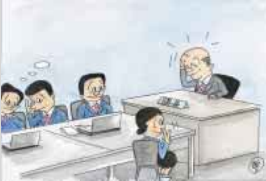
胡麻すりで喜色満面新課長