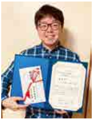
ビジネスアイデアコンテストで優秀賞を受賞