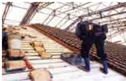
土の量を減らした筋葺き