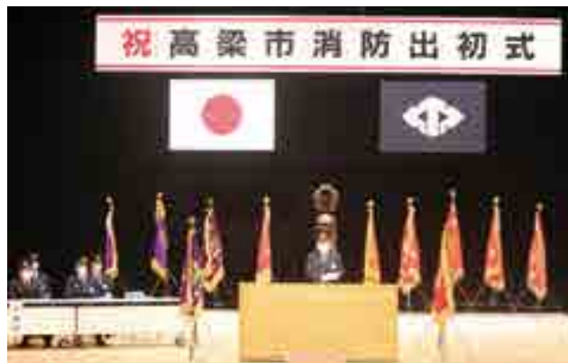
(写真) 1月16日に行われた令和4年高梁市消防出初式。感染防止対策のため、参加者を限定して開催