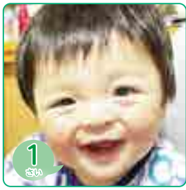
1 さい くにすえ てつとま 國末 天馬ちゃん (川上町上大竹)