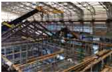
屋根トラス(骨組み)の再構築