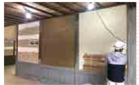
壁の漆喰塗仕上げ