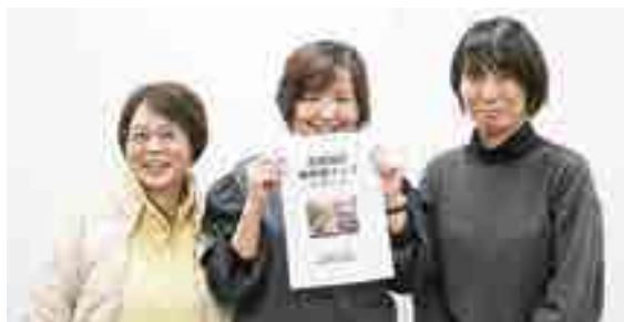
岡山県栄養士会高梁支部のメンバーと、実際に作成した高梁地区食形態マップ

市ウェブサイト「高梁2025～地域医療の高梁モデル構築に向けた100の検討とアクション～」にこれまでの議論の内容などを掲載しています。