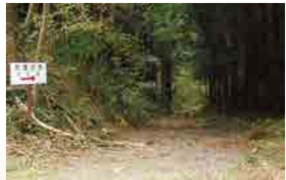
旧吹屋往来 (成羽町羽山付近)