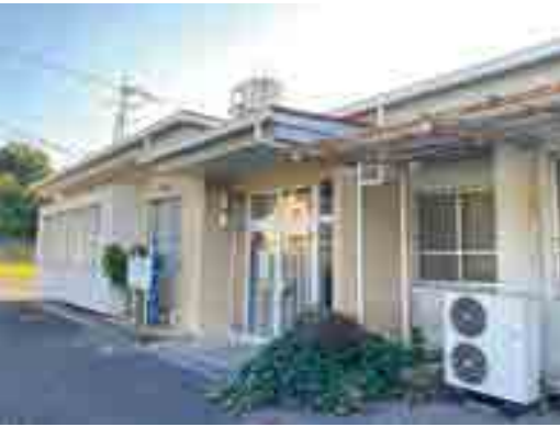
改修中の旧有漢診療所(有漢町有漢 8213)

今回のプロジェクトについて、令和3年12月に備北信用金庫が主催したビジネスアイデアコンテストでプレゼンテーションを行い、優秀賞をいただきました。地域の課題解決と活性化にとって有意義と評価してい