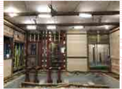
鉄骨と荒壁パネルによる補強

その後、壁や建具、内装の仕上げ、さまざまな設備などの設置を経て、いよいよ完成です。(次回へ続く)