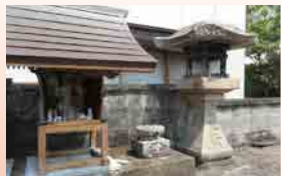
成羽河岸場跡の常夜灯 (成羽町成羽の古町付近)