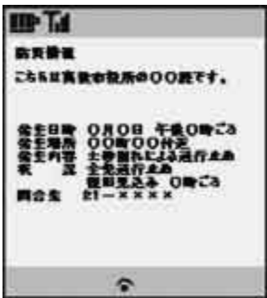
配信情報の表示イメージ

情報、記録的短時間大雨情報、スモッグ気象情報）※配信する気象情報については、高梁地域を対象にしたものと県全域を対象にしたものがあります。詳細は、総合政