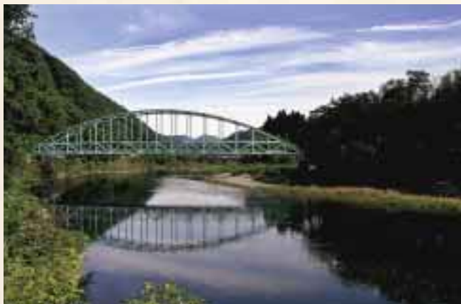
アーチとトラスを川面に映す田井橋。その姿は、橋の形状・色が相まって豊かな自然と響きあっているように思えます。近代化遺産や鉄道遺産を見て歩く時、ここで立ち止まることが贅沢に思えます。

一九三四年の室戸台風では岡山県内の橋梁二千八百五十六が被災し、高梁川水系の橋もその多くが流出しました。『岡山県の近代化遺産―岡山県近代化遺産総合調査報告書（岡山県教育委員会、二〇〇五年）』は、室戸台風のもたらした洪水が次の教訓を残したと記しています。