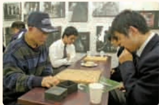
11月17日から行われている高梁高校の将棋サロン。3月まで毎月第3水曜日に開催しています