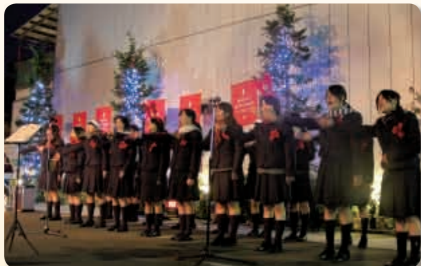
12月17日に行われた高梁高校のクリスマスコンサート。吹奏学部とコーラス部が清らかなメロディーを奏でました