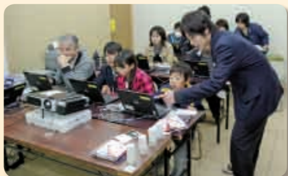
12月4日、高梁城南高校はチャレンジショップなどを行いました。写真はパソコンを使った卓上カレンダー作成講座の様