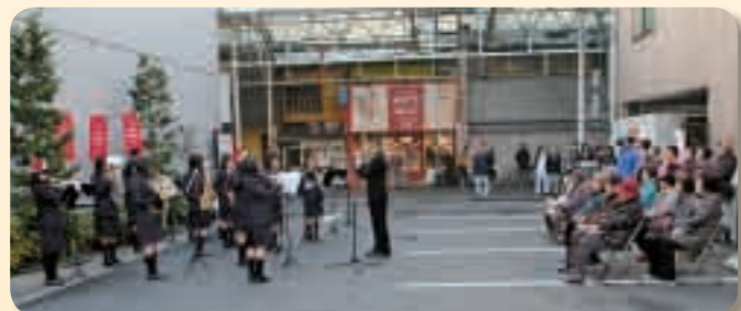
12月20日には高梁城南高校もクリスマスコンサートを行い、吹奏学部がクリスマスにちなんだ曲を演奏しました