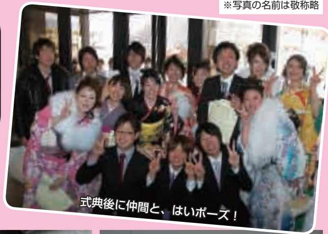
式典後に仲間と、はいポーズ！