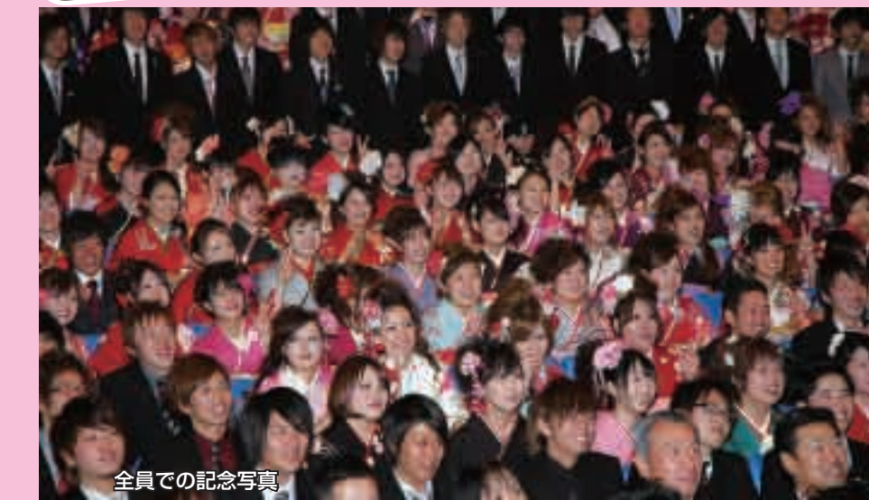
全員での記念写真