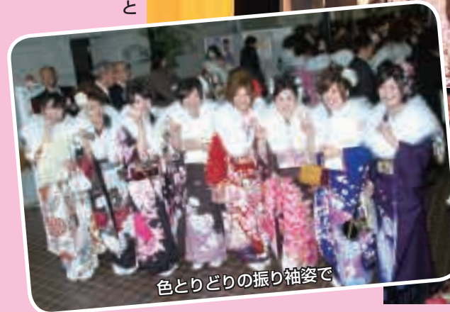
色とりどりの振り袖姿で