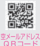
空メールアドレスQRコード

メール配信サービスの利用には、あらかじめ利用登録が必要です。登録は、「e-takahashi@xpressmail.jp」へ空メールを送ってください。登録画面のアドレスが返信されますので、利用規約を確認の上、希望の情報を選択してください。