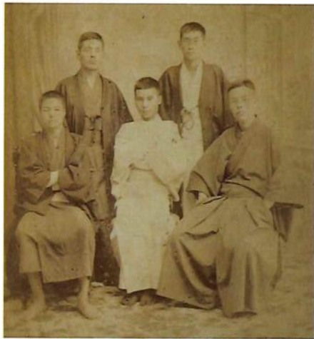
梁川(前列中央)と朝河貫一(前列左)ら友人