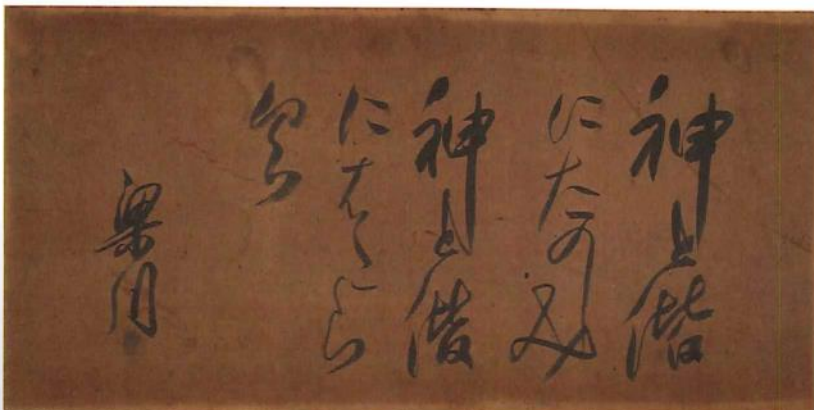
書額「神と偕に楽しみ神と偕に働く」(史料4点はいずれも綱島梁川顕彰会所蔵)