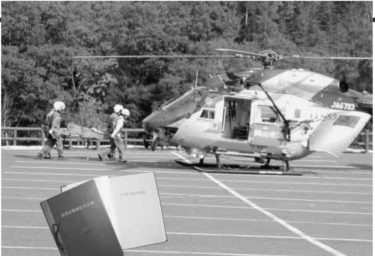
11月13日、うかん常山公園(有漢町有漢)で行われた集団事故災害総合訓練

高梁市防災会議（高梁市防災会議条例により市長を会長とし27人の委員で構成は、災害対策基本法第42条の規定に基づいて、防災に関して総合的な対策を示した「高梁市地域防災計画」を策定しました。この計画は、合併後の市における防災施策の基本を示したものです。今月号では、この計画の概要についてお知らせします。