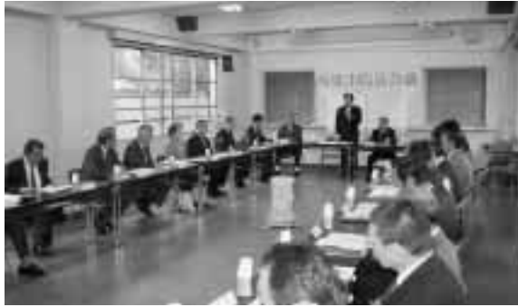
高梁市防災会議(11月11日、市役所会議室にて)

・災害発生のおそれがある気象情報や災害時の情報の伝達方法、災害の危険が迫った時の市民への避難基準 ・避難所の設置、り災者に対する