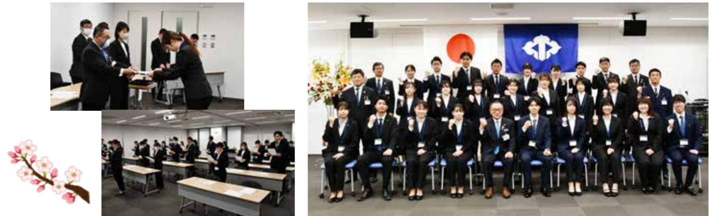
令和6年度新入職員