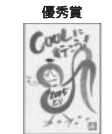
優秀賞 ハモル峰子(46) 備中町平川