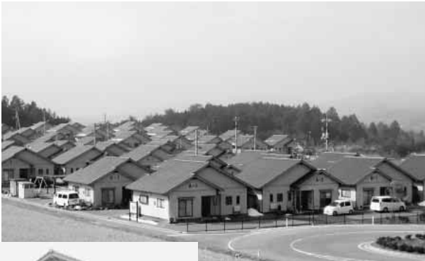
完成した横見住宅

総事業費は今年度分が約1億3700万円、平成10年から全体の総事業費は約9億5000万円です。