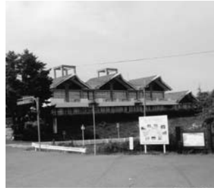
元高山小学校等の跡地利用について

●大月 高山小学校跡地および川上農校跡地利用についての活用方法はどこまで進んでいるのか。