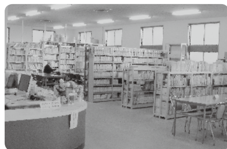
昔と変わらぬ中央図書館カウンターからの眺め