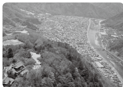
松山城上空から市街地を望む

◆市長 高梁の重点区域は備中松山城から登城道を経て、御根小屋跡までと高梁城下町旧町割区域、高梁景観モデル地区、歴史的町並み景観形成ゾーンの区域。吹屋地区の重点区域は、高梁市吹屋重要伝統的建造物群保存地区と、その周辺区域で、面積は210ヘクタールである。