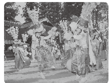
渡り拍子(花笠:鋤崎八幡神社)

整備等、10年間で24の事業を行い、国からは交付金の上乗せ等の支援が強化されることになっている。 高梁、吹屋地区それぞれの地域における指定の範囲、またその範囲内における法的な規制はどうなるのか。