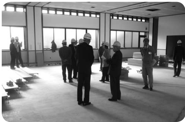
成羽文化センターホールで説明を受ける委員

この審査にあたって、工事の基礎部分の高さを当初設計から変更を余儀なくされたとの新聞報道により、委員全員で成羽文化センターへ赴き、工