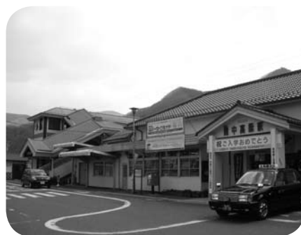
備中高梁駅前の様子

リー化の問題と、新庁舎建設問題をきっちり分けて考え、情報提供する必要があるのではないかと。市長 検討協議会や議云