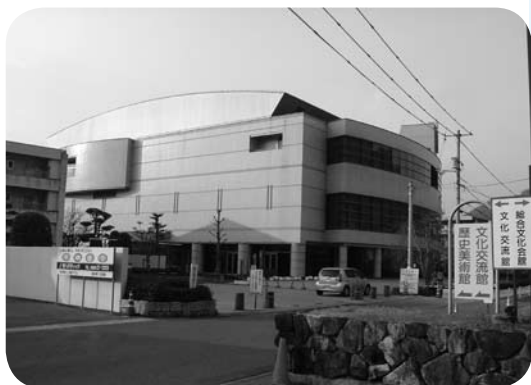
高梁市文化交流館

用も考え、現在ある施設を有効活用し複合を考へるべきではないか。 総務部長 建設位置については、できるだけ早い時期に特別委員会に説明させていただき、その後、速やかに協議し最終決定させていただく。図書館の問題は図書館検討委員会で既に協議していただき、新庁舎との複合的な施設