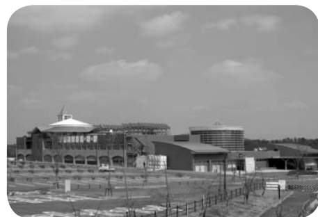
朝霧温泉「ゆ・ら・ら」

市長 1年間の休館については、利用者、また各方面に多大なご迷惑をおかけしお詫び申し上げた