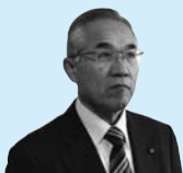
森田 仲一 議員