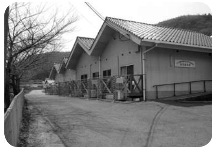
川上町の高齢者住宅「ほのぼの荘」

人口減少率が最も大きく、過疎高齢化が一層進んでいる。医療は電気・水道と同じように生活にとって、なくてはならないものだ。広い地域で家が点在しているところでは医者への往診には限界がある。川上町には「ほのぼの荘」という高齢者住宅があるが、これをモデルとして、川上町地頭地区の既存の公共施設、空き家を利用した高齢者住宅をつくれれば、空き家の活用対策にもなる。高梁市のモデルケースとして医療の集中的提供ができる施策を展開すべきではないか。 市長 医療・福祉は最も重要なことであり、早急に取り組みを始めたところだ。 成羽病院について 妹尾 成羽病院の改築の進捗状況と4月から病院事業管理者を決めて、地方公営企業法の全部適用を行うということだったかどうか？ 病院事務局長 改築は現在、解体工事の発注が終り着工している。病院事業管理者は人事のことであり慎重に進めている。