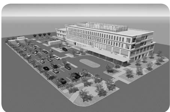
北側から見た成羽病院鳥瞰図

全体で158億3460万円となり、成羽病院改築事業費や国保の療養給付費、介護サービスの利用者の増などにより、前年度に比較で19億5276万円(14.1%)の増額となっています。