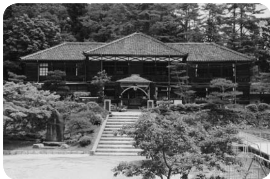
岡山県指定重要文化財の吹屋小学校