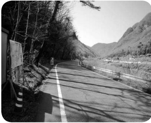
県道新見川上線の様子

ぶ重要な路線である。ご指摘の区間は、川と急峻な山との間で幅員も狭く安全な交通対策がとれていない。現在中断している布瀬地区については取り組みを開始した。早期に改良工事が必要であると認識しており、県に対して着手できると