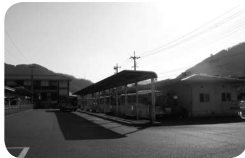
高梁市の交通結節点備北バスターミナル