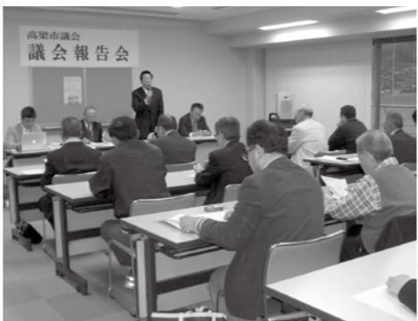
議会報告会の様子