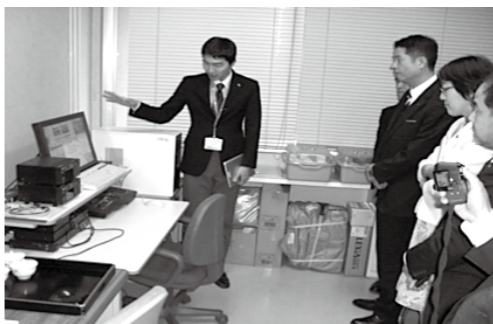
鳥羽市議会の映像配信システムの視察