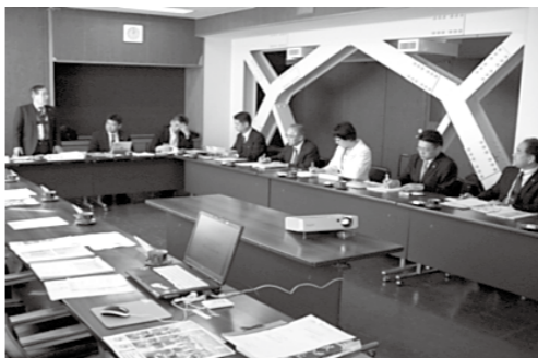
大口町議会との意見交換の様子

今回の視察内容を参考とし、議会だよりについては全面リニューアルに取り組んだところですが、また、本会議のインターネットによる動画配信については、物理的には可能なものの課題もあり、今後、前向きに考えていきます。