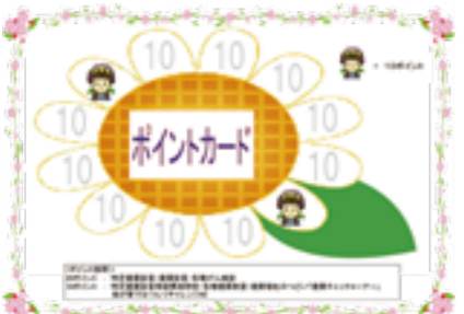
たかはし健康ポイントカード