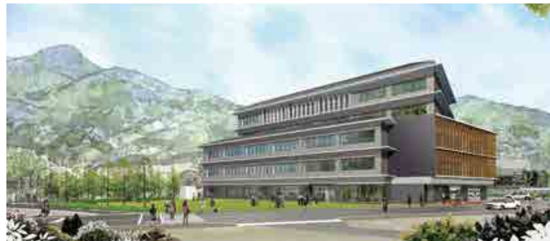
新市庁舎完成予想図