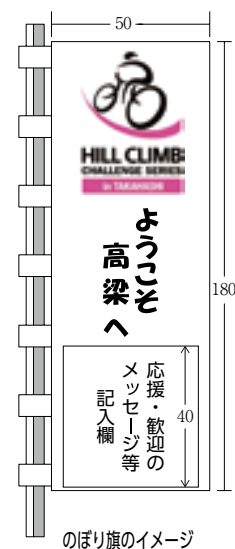
のぼり旗のイメージ

■問い合わせ 実行委員会地域活性交流部会(税務課内 ☎(21)0214) 高梁商工会議所 ☎(22)2091 備北商工会 ☎(42)2412