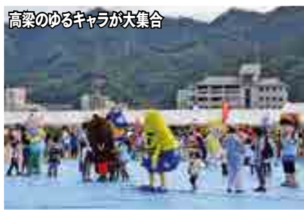
高梁のゆるキャラが大集合