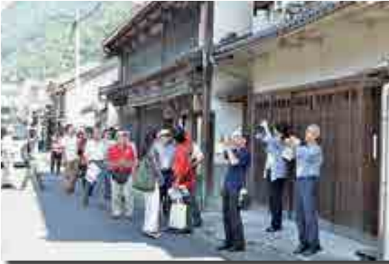
本町町家通りの保存活動を学ぶ

町並み保存に関わる市民団体が集まる「第36回全国町並みゼミ倉敷大会」(同大会実行委員会主催)の分科会が開催されました。