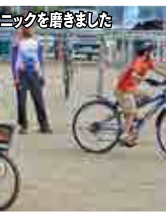
ニックを磨きました