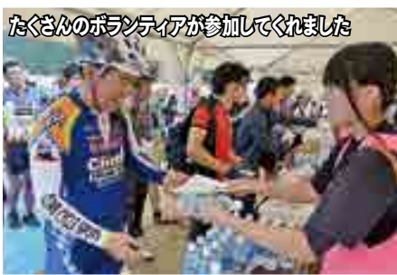
たくさんのボランティアが参加してくれました