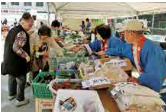
新鮮野菜や特産のピオーネを販売