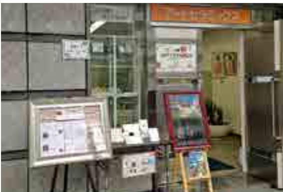
ショールームの入口でPR

タイガーマシン製作所(落合町阿部)の子会社、タイガーインターナショナルの東京銀座ショールーム前に、セラミックスに特殊技術で焼き付けた備中松山城の観光ポスターを展示しています。