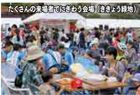
たくさんの来場者でにぎわう会場（ききょう緑地）