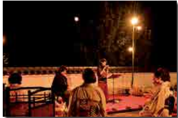
美しい月が会場を照らす

「風ぐるま月見茶会」(有漢町観光協会、NPO法人夢風車うかん主催)が開かれ、美しい月明かりの中、市内外から参加した約200人がオカリナと琴の音色に魅了されました。