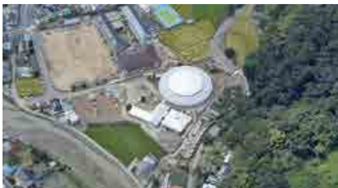
▲中央ドームが川上幼稚園。右側が氾濫した西谷川。隣接する川上学校給食センターも浸水した（9月5日上空から）