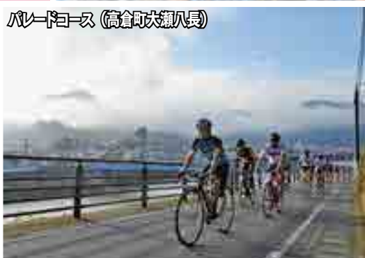
パレードコース（高倉町大瀬八長）