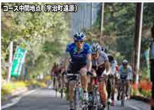
コース中間地点（宇治町遠原）