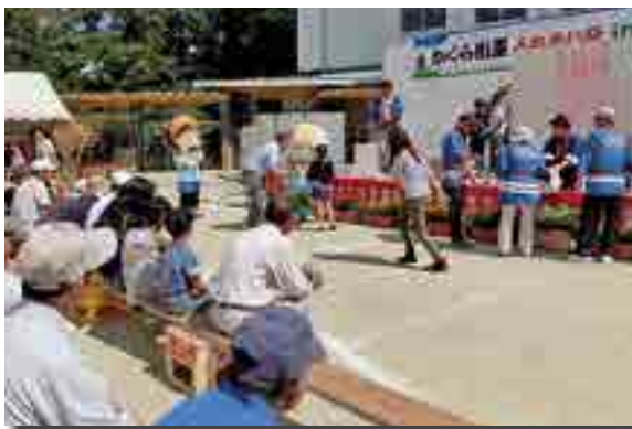
まつ姫 & やまジイも登場