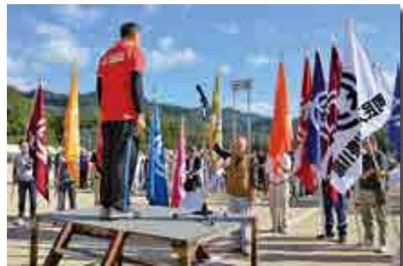
実行委員長に選手宣誓

「第29回成羽町民スポーツ祭」(同実行委員会主催)が秋晴れの空の下、開催されました。