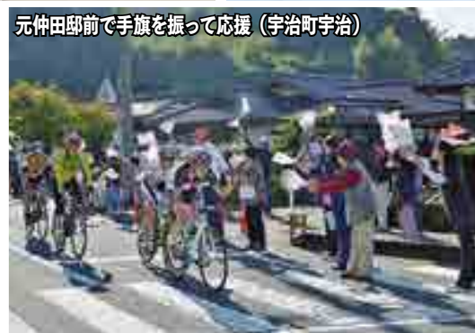
元仲田邸前で手旗を振って応援（宇治町宇治）