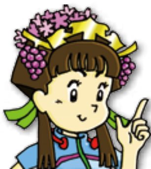
高梁市健康づくりイメージキャラクター まつ姫