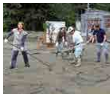
▲約100人の関係者が参加して泥を取り除いた(9月8日)

ことから開始。このことを聞きつけた、高梁青年会議所、高梁市青年経済協議会、行政・学校関係の皆さん、100人以上が、5日から8日に掛けて側溝の泥を取り除き、ほうきで掃いてきれいになりました。