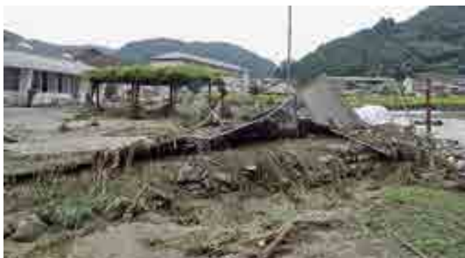
▲被災した川上幼稚園。フェンスや遊具が流された（9月3日）