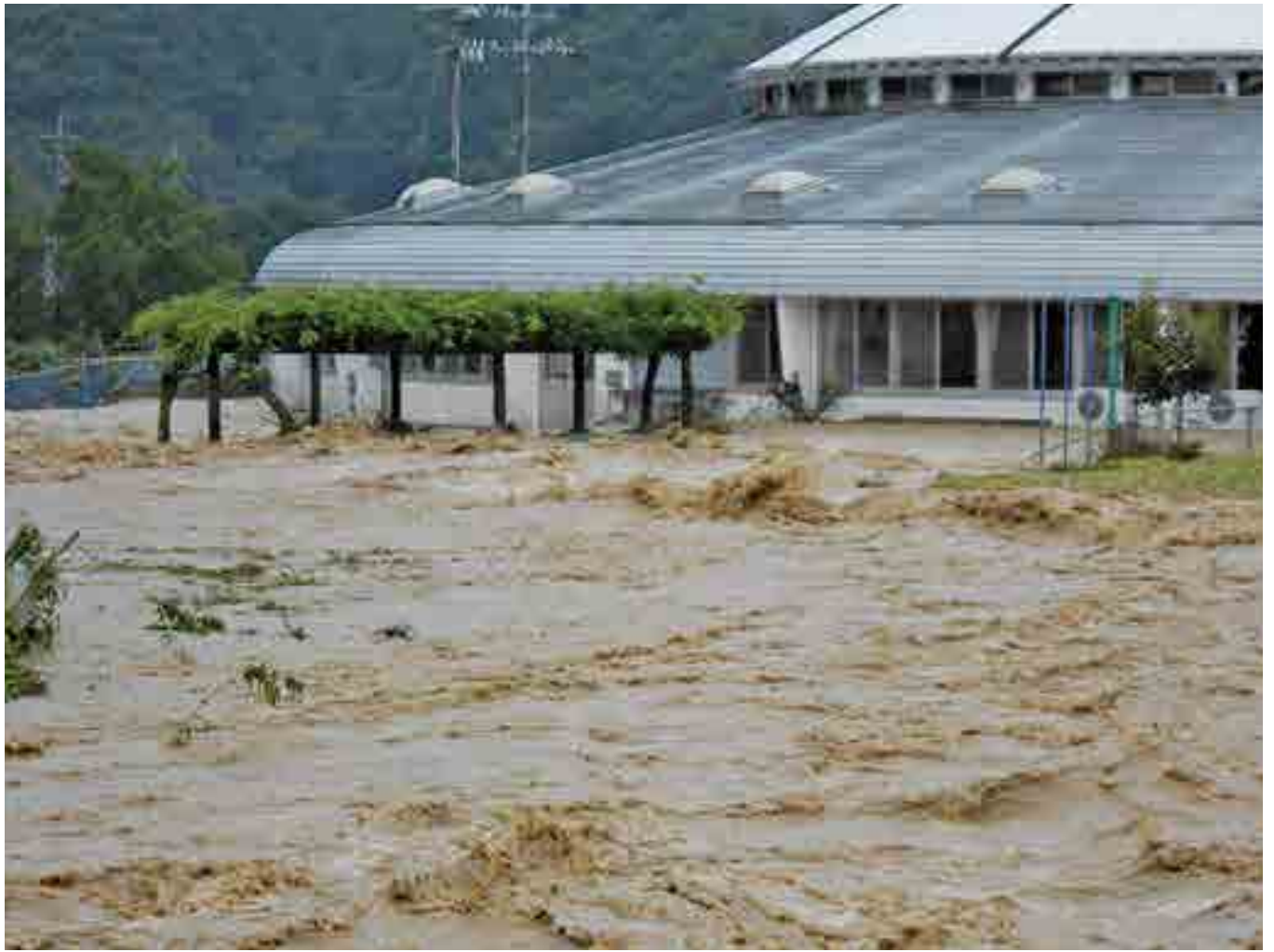
▲西谷川の氾濫で浸水する川上幼稚園と川上児童館（川上町地頭・9月2日）