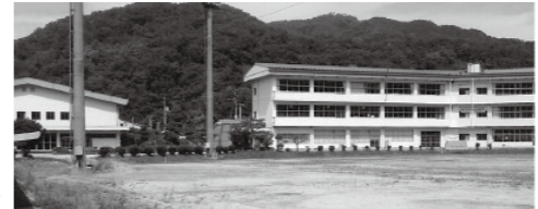
整備が望まれる 旧川上中学校▶

Q. 学校教育を補完するものとして、高梁学習サポート教室を支援することはできないか