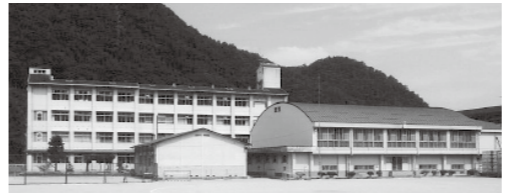
◀中学校仕様への整備が早急に望まれる旧高梁城南高校川上校地

妹尾 川上地域のコミュニティの中心な場所である川上中学校跡地の整備を早急に行うべきではないか。 教育次長 窓口を一本化して、まちづくり協議会と協議を行いながら整備を進めていく。