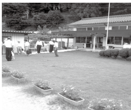
芝生化された津川幼稚園の園庭

ラブが行っているが、想像以上に大変であるとのことでした。川上中学校の校舎と、移転先となっている旧高梁城南高校川上校地の現状を視察しました。中学校と高校では、校舎等の仕様が異なるため工夫して使用しているが、今後改善すべき点は行政と話を進めていくと校長から説明がありました。