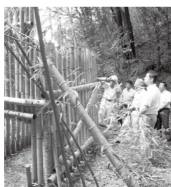
竹と間伐材を利用した捕獲罠

くそうで、本市でも今後計画されているさまざまな事業について、公民連携の手法は大いに参考になりました。