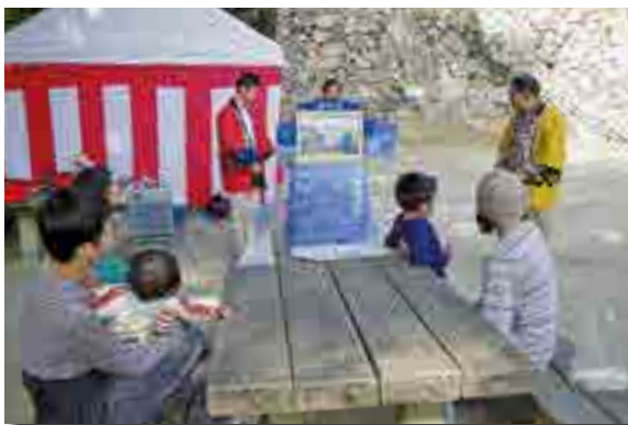
山田方谷を紹介する紙芝居