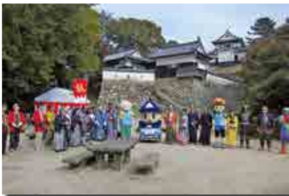
甲冑姿の武士や町娘姿の「高梁お・も・て・な・し隊」

ボランティアで結成した「高梁お・も・て・な・し隊」が初陣を飾り、殿様や姫様、武士、町娘などの衣装をまとい、登城してきた観光客への声掛けや簡単な観光案内、高梁紅茶や銘菓ゆべしの振る舞いなど、「おもてなしの精神」で来場者を出迎えていました。