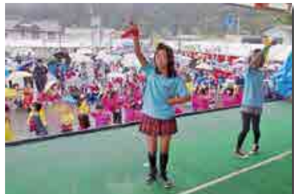
元気いっぱいのダンスショー

「川上ふるさと物産まつり」（同まつり実行委員会主催）が開催され、地元のコミュニティーや各団体が、山菜おこわなど地域の手作り特産品や新鮮な野菜と果物を販売。小雨にもかかわらず、ステージやテントの前には、たくさんの人が並びました。