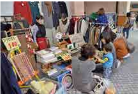
物を大切に、フリーマーケット

朝霧温泉ゆ・ら・らを会場に「環境フェア in たかはし2013」（市環境衛生協議会主催）が開かれました。