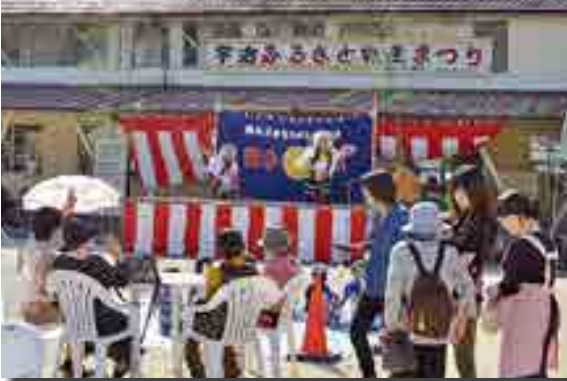
勇壮に舞う子ども神楽

今回で23回目となる恒例の「宇治ふるさと物産まつり」（同まつり実行委員会主催）が開催され、地元で採れたばかりのマツタケやピオーネ、新鮮野菜などの販売やダンス、銭太鼓などの多彩なステージイベントがあり、家族連れらが楽しみました。