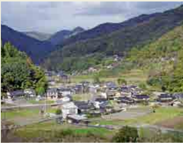
「日名本村」付近を望む

私たちが住んでいる周りには、たくさんの地名があります。地名は私たちの生活に必要であるため、できたものです。それゆえ、意味や由来などが話題になり興味湧きます。地名はそれぞれの土地のイメージを表現し、その地域の歴史や土地の事情や性質を言い表して、必ず何らかの意味を持っていきます。まさに地名は「歴史の生き証人」なのです。このような地名