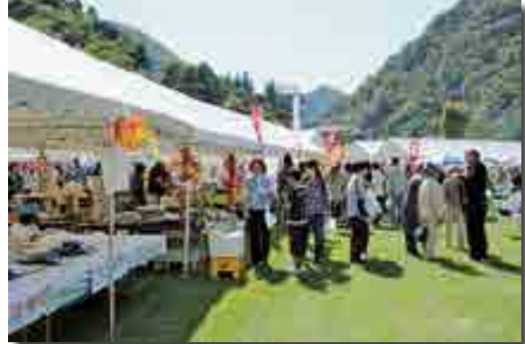
特産品を買い求める来場者

「備中ふるさとまつり」（同まつり実行委員会主催）が開かれ、多くの来場者が訪れました。