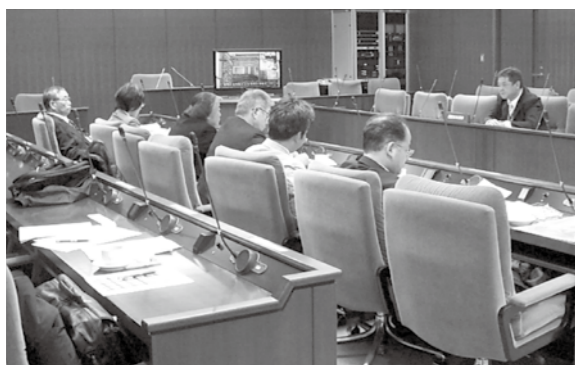
足立区で説明を受ける委員

ていない老朽家屋の所有者等に対して指導・勧告を行うことを規定していますが、併せて指導・勧告に従って老朽家屋を撤去する所有者に対して助成措置を行うことも規定しています。高梁市の空き家対策とは若干ニュアンスが違いますが、本市における今後の空き家対策に十分活用できる点が多々あり大変参考になりました。