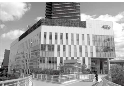
くまもと森都心プラザ図書館

熊本駅前の5階建て複合施設の3階と4階を活用しています。この図書館も豊後高田市と同様に指定管理者が運営しています。館長は、職員の幅広い知識と経験、また図書館を運営する情熱が重要であると話されていました。2日間、大変有意義な視察でした。