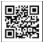
高梁市メール配信サービス登録用QRコード