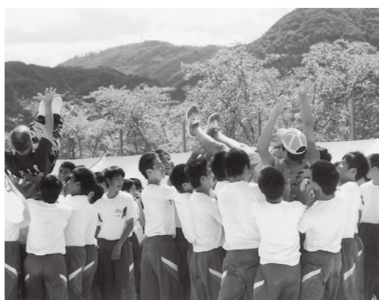
高梁中学校運動会

状況はどうか。 教育長 他校でも児童・生徒が話し合い、保護者と一緒に考えて実践が進んでいる。今後、校長会、PTA連合会と協力し生徒会執行部を交えて各校の取り組みの情報交換を行う。