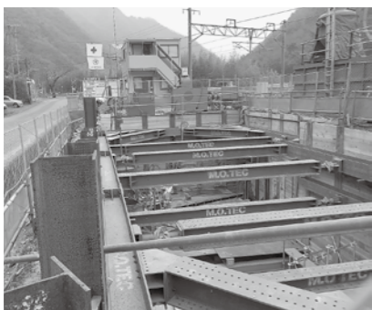
産業経済委員会では、議案審査の前に全員で現場を視察、確認しています。(写真は、広瀬の雨水ポンプ場工事現場)

委員 場外馬券場とはどういったものなのか、場外馬券場を旧「ゆ・ら・ら」に設置することについてどうなのかなどについて、広く意見を聞き判断する必要がある、市民に意見交換の機会を提供するといったことから継続審査にすべき。 (賛成多数で継続審査)