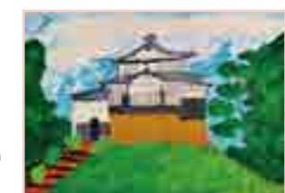
平成27年度写生の部・小学中学年部門 テーマ「高梁市の景色・風景」 最優秀賞 繁田陽向くんの作品