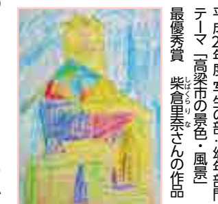
平成27年度写生の部・幼年部門 テーマ「高梁市の景色・風景」 最優秀賞 柴倉里奈さんの作品