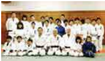
高粱柔道スポーツ少年団、新年の稽古初め。

また、高粱柔道スポーツ少年団の稽古に顔を出し、指導の手伝いをさせていただいています。興味がある方は、気軽に見学に来てみてください。最近、吉備国際大学の留学生も参加してくれています。Facebookページ「地域おこし協力隊 岡山県高粱市」もぜひご覧ください。