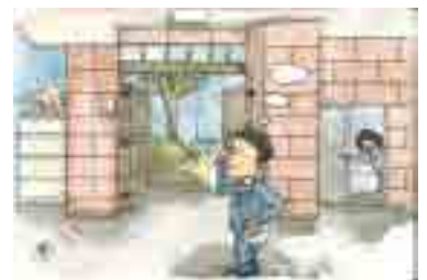
「婚活にひと呼吸入れる 門構え」