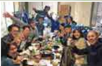
地域おこし協力隊の忘年会。ゲストハウスもこんなふうに毎日が楽しい場所になりたい。