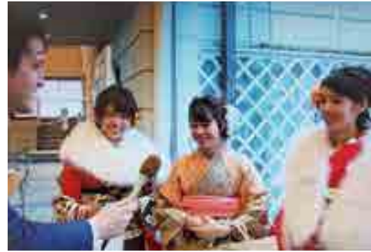
夢を尋ねると、「親に恩返し」「自立」「世界を巡る仕事を」と三者三様。

高粱市総合文化会館で挙行された2017年の成人祝賀式にお邪魔して、人生の重要な階段を上がった皆さんを覗かせてもらいました。 フランス人は18歳で成人になり、新しい義務と権利、そして自由を得ることは確かに感じますが、個人的な誕生日パーティー以上の儀式は行いません。ですので、日本の成人式に多くの同世代の若者が集まるのを見てびっくりしました。 ホールの中で、初々しい背広に身を包んだ男性、立派な和服を着て、早朝の美容院でセットされた髪型の女性たちの姿を見れば、この式典がどれほど重要視されているかがわかります。 会場には、幼なじみとの再会を喜びはし