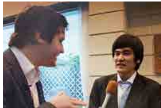
「ここまで育ててくれて感謝しています」としっかり語ることができる良い機会がかもしれません。

いざ、将来を決める時が来たという真剣な表情の人もいたり、興奮と決意、甘えとのんきが混在した、不思議な雰囲気漂っていました。 彼らは、少々年寄りじみた成人式という伝統を続けているという認識はないものの、やはり真摯な態度をとっているのです。この矛盾は、ある社会グループから他のグループへ(若者から大人へ)の人の移動を整理する「通過儀礼」の本質ではありませんか。(フランス人は儀礼に従わずにマイペースで大人になると言えるかもしれません)