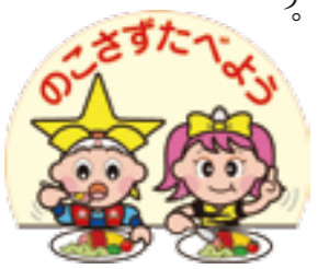
ももっち・うらっち ©岡山県