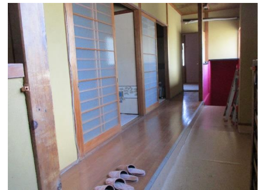
↓ 3階 (住居スペース)