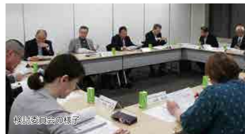
検討委員会の様子

一方、この計画の普及・啓発ですが、将来の高梁市の医療がどのような方向を目指しているのか、関係者の皆さんにも理解していただき、日々の業務に役立てていただきたいと思います。 司会 最後に、高梁市医療計画検討委員会の会長である中角さんか