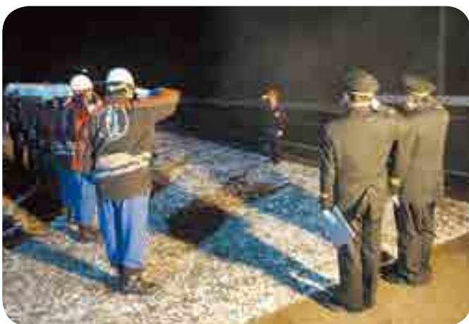
歳末夜警にあたる消防団員