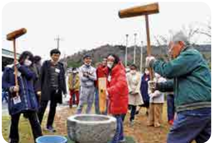
懸命に餅をつく参加者

成羽町成羽の有志団体「天満A B M会」は今年で7回目となる「餅つきDEフェスタ ～外国人と市民の交流会 2018～」(市国際交流協議会と共催)を開催しました。