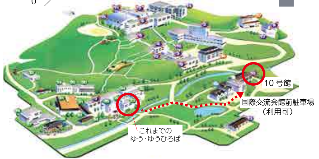
10号館 国際交流会館前駐車場(利用可)