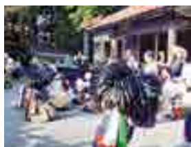
「跳び子」として参加した秋祭り