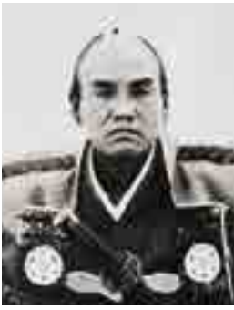
川田 甕江

山田方谷は困難な藩政改革を見事に完遂した政治家として知られていますが、多くの優れた人材を育成した教育者としても高く評価されています。その門下生の中で俊英とされているのが、川田甕江と三島中洲です。方谷は「剛毅」を2文字に分け、甕江に「剛」、中洲に「毅」の名を与えています。幕末から明治の激動期、備中松山藩存亡の危機を乗り切ったのも、彼ら門人の働きが非常に大きかったとされています。 両者は20歳前後に知り合い、終生の盟友となります。ともに天保元(1830)年の生まれで、生誕地は備中南部、農商家の出身で方谷の推挙を受けて備中松山藩士となったこ