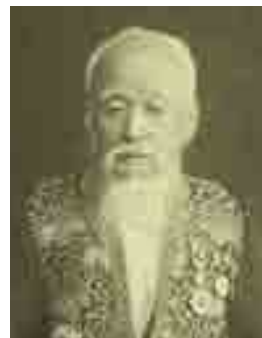
三島 中洲

時には方谷の推挙により備中松山藩士に取り立てられました。鳥羽・伏見での敗戦後、朝敵となった中で藩の中枢として備前岡山藩による征討、城の無血開城、藩の存続という難局に立ち向かい、その危機を乗り切る重要な役割を担いました。