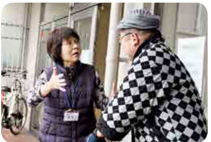
訓練で行われた声かけ

高梁総合福祉センターから紺屋町筋 はいかい を徘徊する認知症高齢者を想定した「認知症高齢者声かけ訓練」(市主催)を行いました。