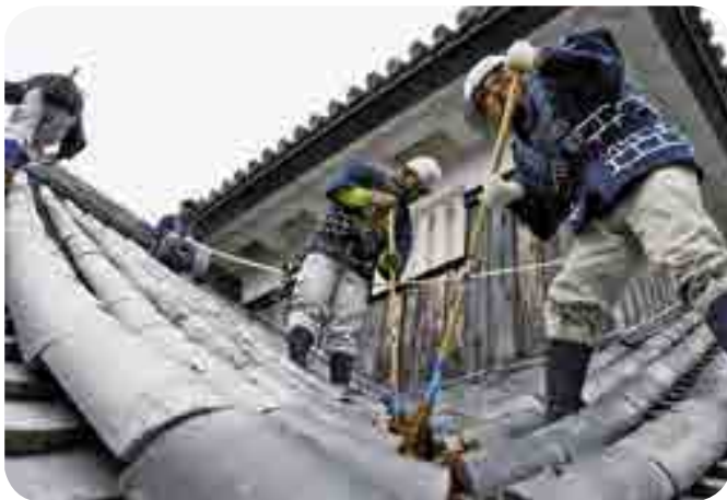
屋根にたまった落ち葉を清掃

国指定重要文化財の備中松山城天守と二重櫓、 五・六の平櫓 にじゅうやぐら ひらやぐら で、新年を迎えるために毎年恒例の「すす払い」が行われました。