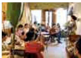
チャリティーイベントで篠笛を演奏