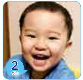
ふじもろ うり 藤村セドラチェック羽里ちゃん (上谷町)