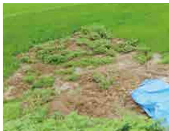
土砂が流入した水田

災害査定が終了した案件から随時工事の発注を進めています。件数および被災規模も多大なため、完全に復旧するまで3年程度を要する見込みです。