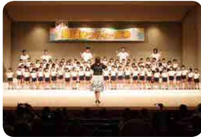
高梁中央・落合保育園なかよしチルドレンの合唱

「第34回童謡まつりイン高梁」(高梁市童謡のまちづくり推進委員会主催)に市内で活動する合唱グループなど23団体が参加。満員の観客を前に日頃の練習の成果を発揮し、美しいハーモニーを会場に響かせました。