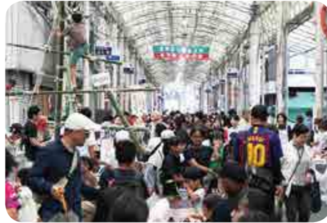
多くの家族連れでにぎわう

「つくる」「あそぶ」「みるきく」「たべる」「うる」をテーマにした「わくわく子どもフェスタ21」(同実行委員会主催)が開催されました。