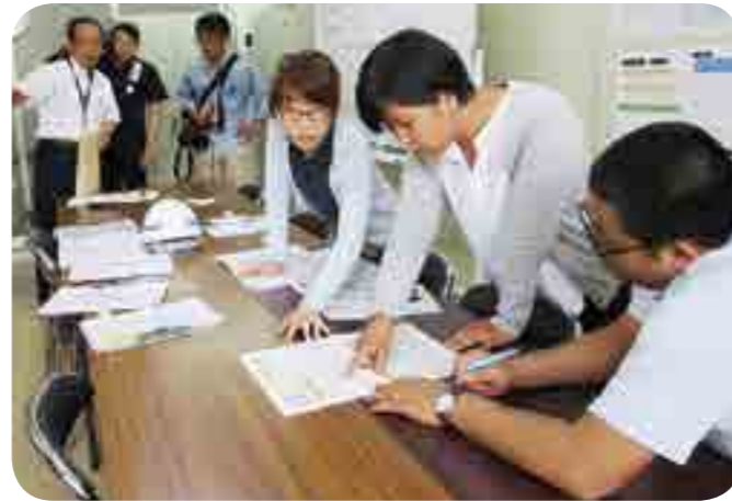
模擬訓練を行う関係者ら