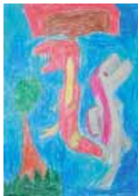
踊る恐竜 神近 匠(8) 津川町八川