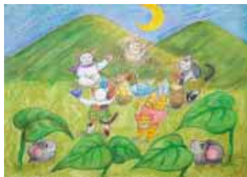
月夜の楽しみ 山本美貴(32) 川上町七地