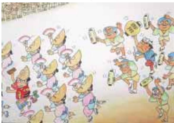
タイム・スリップ 関としお(62) 東京都