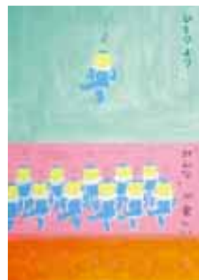
ひとりより… 西林由花(28) 落合町福地