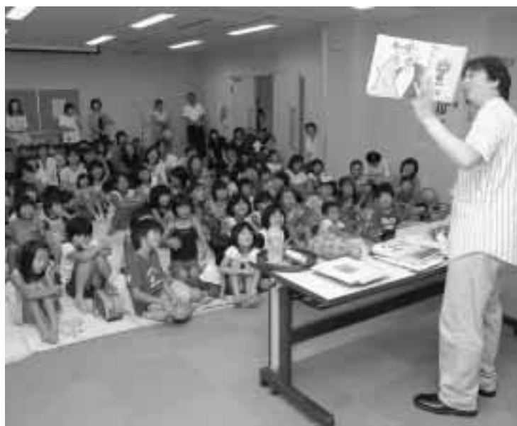
さまざまな子育て支援を行いました。(子どもたちへ絵本の読み聞かせ)

額は、収入が226億4123万円、支出が225億5782万円。前年度と比べ収入・支出とも9.4%の減となりました。これは行財政改革に基づく人件費の削減や普通建設事業の縮小によるものです。 また、特別会計を合わせた総決算額は、収入が409億6020万円、支出が404億8918万円となりました。