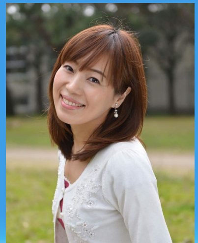
講師 お天気キャスター きし まゆみ 岸 真弓 (気象予報士・防災士)