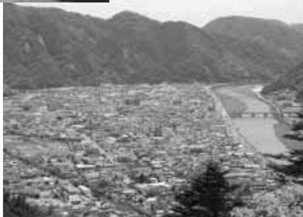
備中松山城からの市街地の眺め ▶

市では観光シーズンに合わせて、昨年実施し多くの利用があった「吹屋ふるさと村観光周遊バス」と「備中松山城観光乗合タクシー」の運行を3月から再開。これは、グステイネーションキャンペーンの地域イベントの一つにもなっています。 観光周遊バスは11月25日までの土・日・祝日(4月28日から5月6日まで)は毎日、観光乗合タクシーは11月末まで毎日運行します。