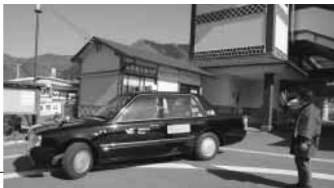
▲3月1日から運行を再開した備中松山城観光乗合タクシー

た映画「バッテリー」のロケ地を巡るバスツアー、桃太郎研究家の故・小久保桃江さん（備中町出身）のコレクションを中心とした桃太郎に関する企画展など、県内各地でさまざまなイベントが予定されており、観光客の増加が期待されています。