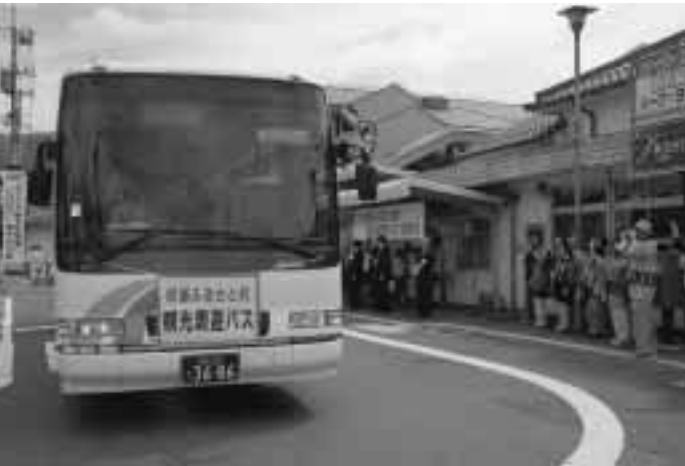
▲昨年多くの利用があった吹屋ふるさと村観光周遊バス（3月17日から運行を再開）

これまでの取り組みを踏まえ、豊かな自然環境、観光資源を生かしながら、より多くの人に高梁へ訪れてもらえるよう事業の充実を図っていきます。